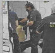
Un momento de la entrega.

La Policía Local, junto a voluntarios de Protección Civil, entregó a Mallorca Sense Fam los alimentos recogidos en su campaña de productos destinados a personas necesitadas. La campaña se ha desarrollado durante un mes y la recogida se ha llevado a cabo en todas las comisarías y dependencias policíacas.