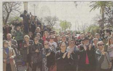
El acto contó con la asistencia de cerca de un centenar de personas.