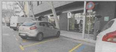
La zona de reserva de plazas llega ya hasta el hotel.

La Policía Nacional aumentó hace unos quince días la reserva de plazas de aparcamiento que tiene en la calle Simó Ballester, junto a la Jefatura, para disgusto de vecinos y ciudadanos en general que ven cómo se han reducido aún más las opciones de estacionamiento.