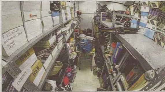
Imagen de archivo de objetos hallados y llevados a la oficina, que actualmente está en el edificio Avingudes.

Desde la Policía, que gestiona esta oficina, se admite que la reducción del horario de atención ha sido debida a las diversas jubilaciones de policías que estaban destinados a este servicio sedentario. La oficina, explica una fuente policial, «es atendida por agentes de cierta edad y tras algunas jubilaciones los que han quedado tienen un régimen de días libres que hace imposible que se pueda cubrir todos los días, habría que enviar a este destino policías que ahora prestan su