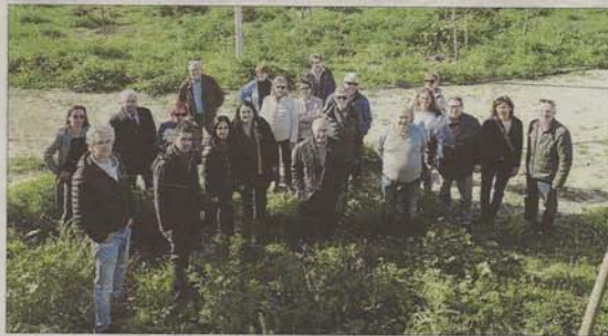
Un grupo de vecinos de barrios cercanos paseó por la zona para mostrar las deficiencias.

El que estaba llamado a ser uno de los proyectos estrellas del Pacte de Cort ya lleva año y medio de retraso sobre la fecha inicial de inauguración. El retraso se debe a las modificaciones del proyecto que han debido hacerse, pero nada justifica la falta de mantenimiento ni tampoco que no se informe de cuándo podrá tener lugar la apertura al público.