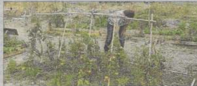
Huerto urbano para los vecinos en Son Espanyolet.