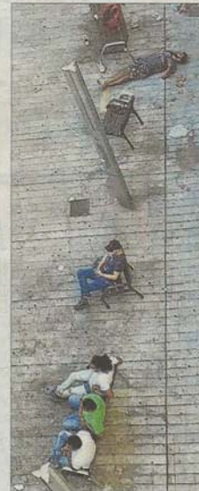
Amanecer. Personas en la plaza el pasado domingo a las 7.30 horas, una de ellas está tirada y dormida en el suelo.

El afectado afirma que «la Policía Local elaboró un informe que aconsejaba la retirada de los bancos de la plaza por considerar que era un punto conflictivo». Dicho informe, asegura, «está en poder del regidor del distrito de