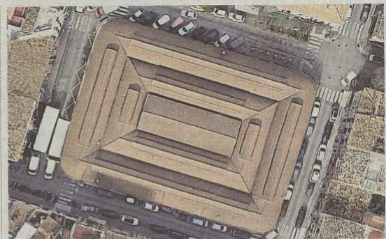
El mercado ocupa la totalidad de la plaza de Santa Catalina.

mercado que, en la práctica, no es tal, al menos entendida como un espacio libre público no edificado. Resulta que el decreto que permite a los bares y restaurantes ocupar desde el pasado mes de mayo con mesas y sillas el espacio de los estacionamientos de vehículos situado delante de su local, excluye aquellos que dan a una plaza o a una calle peatonal. Si lo anterior tiene sentido en la mayoría de casos con el fin de que las terrazas no quiten espacio a los peatones, en el caso de la plaza del mercado de Santa