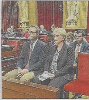
Hila y Moilanen, ayer.