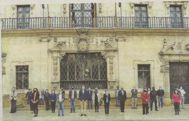
Imagen del minuto de silencio celebrado ayer en el Ayuntamiento de Palma.

Todos ellos mostraron con sus declaraciones su repulsa por este asesinato. «Este minuto de silencio no es simbólico, es un minuto de silencio que quiere expresar nues-