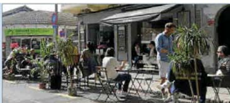
Una de las 'nuevas' terrazas, en Santa Catalina.

El paisaje urbano de la ciudad está cambiando estos días con las ocupaciones, cada vez más numerosas, de las terrazas de bares y restaurantes de plazas de aparcamiento. La Policía Local y la Policía Nacional han intensificado su vigilancia este fin de semana.