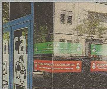
Carteles en el edificio Avingudes que avisan que hace falta cita previa para Urbanisme pero no para la OAC.