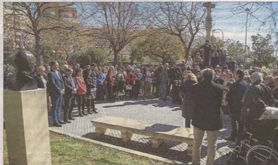
El acto se celebró en la plaza Porta del Camp, donde se encuentra la casa donde vivió el alcalde fusilado. DM

La conmemoración del 24 de febrero tuvo continuidad por la tarde en el Mur de la Memòria del cementerio de Palma, donde se recordó a todas las personas que fueron asesinadas por el fascismo