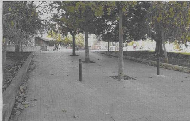
A principios de 2019, Cort colocó pilones para impedir el paso de vehículos a la plaza. u. t.

"Me sorprende que en todo este tiempo no ha habido un avance", comentó la Defensora sobre las cuestiones pendientes de resolver y que afectan directamente a los ciudadanos de Palma. "Es un error pensar que los problemas se habrán resuelto por las nuevas circunstancias", mencionó