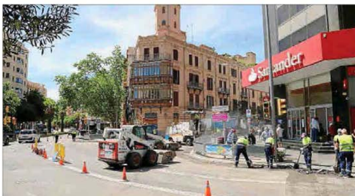
Las obras en la vía pública son una de las principales causas de ruido en las ciudades.