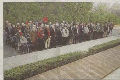
Momento del acto unitario junto al Mur de la Memòria.