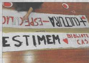
Los vecinos llevan meses luchando por el casal.

Las condiciones que existen hasta el momento presente, explica, son que