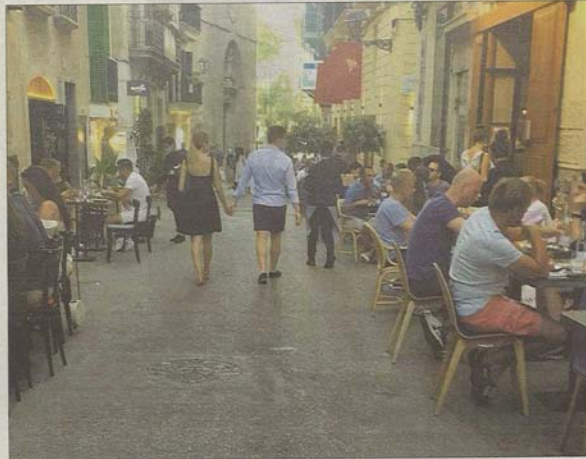
Imagen de la calle Sant Joan ocupada con mesas y sillas pegadas a la fachada de los establecimientos. AA.VV. SA LLONJA

En este caso el número de expedientes ha pasado en tan solo un mes de 138 a 195. Por último, por lo que se refiere a los expedientes dirigidos al Defensor del Pueblo, que también se tramitan a través de la oficina municipal de la defensora, no han sufrido variación, puesto que en junio había tres asuntos de estas características activos y en julio siguen siendo los