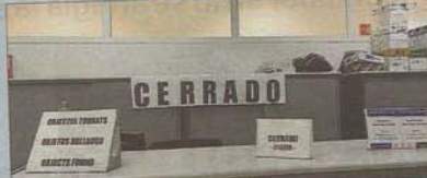
La oficina solo abre martes y miércoles por la mañana desde diciembre.