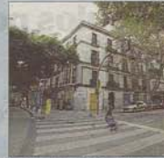
Imagen de la calle Nuredduna.

Cort recuperará en septiembre de 2021 la gestión del aparcamiento de las Avenidas y el edil de Mobilitat explicó que «las posibles alternativas para los vecinos de la zona irán ligadas a este parking» cuando se peatonalice la calle Nuredduna. Por eso, se descarta un nuevo aparcamiento, como reclama Cs.