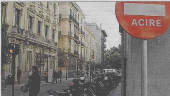
Tan solo los residentes pueden circular por las zonas Acire del centro de la ciudad.

Por si fuera poco, esta persona nunca recibió las notificaciones en su domicilio, al no encontrarse en él, y fue notificada por edicto (mediante la publicación en el BOE), la que «con frecuencia conduce a una situación de indefensión», señala la defensora. Cuando tuvo constancia de las multas ya había pasado casi un año desde la fecha de la primera y todas estaban en vía ejecutiva con las consecuencias que ello supone. La principal es que en este momento ya no se pueden anular y el motivo de la san-