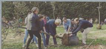
El alcalde Hila y los consellers Mir y Negueruela, en el acto.

Un centenar de ciudadanos colaboró ayer en la siembra de hasta 300 árboles y especies arbustivas en el Parc de sa Riera, convocada por Cort. Se sembraron diferentes especies como pinos, encinas o mirtos del vivero municipal o del centro forestal de Balears.