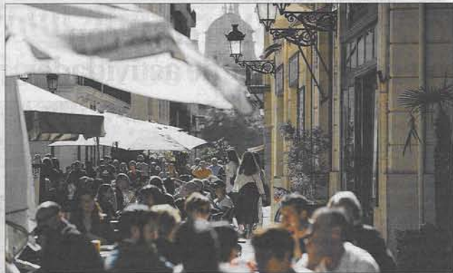
Los derechos de quien ejerce una actividad económica a menudo colisionan con los de los vecinos.

Los padres ojerosos, con el oído afinado por meses de insomnio con el único objetivo de aten-