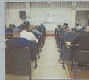
Pruebas para cubrir plazas de policía el pasado fin de semana.

La Policía Local ha empezado el proceso de ampliación de puestos de mando, reservando un 40% de las plazas para mujeres, después de que el pasado sábado se publicasen en el BOIB las bases que regirán el proceso selectivo para 21 plazas de oficial, 14 plazas de subinspector y una plaza de mayor.