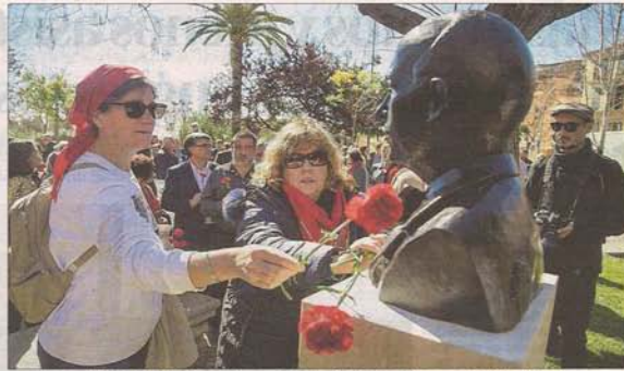
Dos mujeres de Memòria de Mallorca entregan claveles al busto recién inaugurado de Emili Darder.

Para que no se olvide el legado del último alcalde de la República, el historiador Antoni Marimón abogó ante los presentes no solo por homenajes como este, sino por "transmitir su pensamiento hacia el futuro, un futuro con más igualdad, más progresista, con más cultura, un mayor acceso a la educación y más arraigado a nuestra tierra". El regidor Llorenç Carríó recordó que Emili Darder impulsó numerosas mejoras en esta ciudad para que fuese "más digna", entre ellas la canalización de las aguas y la construcción de escuelas públicas, dispensarios y guarderías para que las mujeres trabajadoras tuviesen un lugar para llevar a sus hijos.