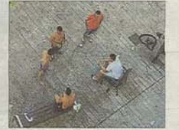
Jóvenes bebiendo y sin mascarilla en la plaza, el pasado fin de semana.