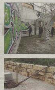
Fotos del estado del parque, con material que parece abandonado, pintadas, árboles caídos y malas hierbas.