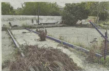
Las pistas de petanca están sucias y abandonadas.

que sea. Desde al menos el anterior mandato se constató que, a nivel presupuestario, la oficina de la Defensora es algo así como un ente inexistente que no puede actuar autónomamente puesto que depende de alcaldía. Por ello, por ejemplo, no puede contratar a técnicos independientes para que realicen un informe sobre una determinada cuestión, o decidir contratar a más personal y medios. La cantinela de un cambio organizativo para dar más autonomía a la Defensora es recurrente, pero lo cierto es que ha pasado otro