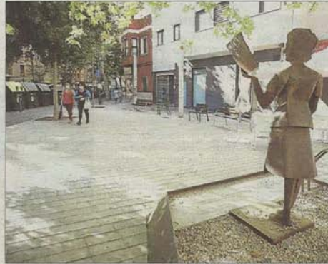
Vista de la plaza, que apenas disfrutan los vecinos.

Una queja habitual en este tipo de situaciones es que cuando se llama a la policía ésta no acude, «y en nuestro caso es siempre así», comenta desesperado el denunciante.