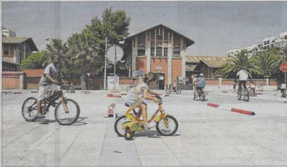
La empresa concesionaria debe hacerse cargo también de la nueva impermeabilización de la plaza de s'Escorxador, de forma que quede suficientemente protegida. Este espacio tiene las actividades restringidas.