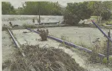
Las pistas de petanca están sucias y abandonadas.

que sea. Desde al menos el anterior mandato se constató que, a nivel presupuestario, la oficina de la Defensora es algo así como un ente inexistente que no puede actuar autónomamente puesto que depende de alcaldía. Por ello, por ejemplo, no puede contratar a técnicos independientes para que realicen un informe sobre una determinada cuestión, o decidir contratar a más personal y medios. La cantinela de un cambio organizativo para dar más autonomía a la Defensora es recurrente, pero lo cierto es que ha pasado otro