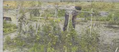
Huerto urbano para los vecinos en Son Espanyolet.

La defensora de la Ciudadanía, Anna Mollanen, lamentó que Cort todavía no ha adjudicado las 126 parcelas de los diversos huertos urbanos municipales de Palma, pese a que en verano del año pasado presentó las nuevas bases que deben regir esta asignación.