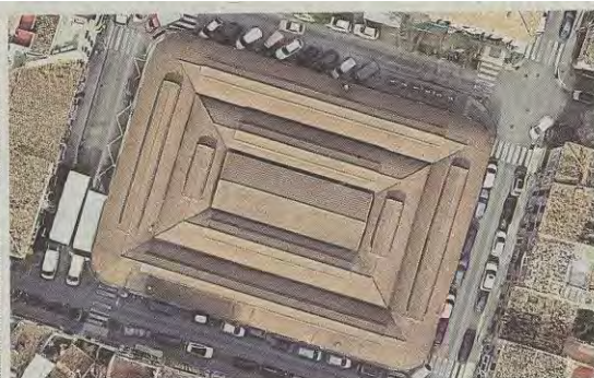
El mercado ocupa la totalidad de la plaza de Santa Catalina.

mercado que, en la práctica, no es tal, al menos entendida como un espacio libre público no edificado. Resulta que el decreto que permite a los bares y restaurantes ocupar desde el pasado mes de mayo con mesas y sillas el espacio de los estacionamientos de vehículos situado delante de su local, excluye aquellos que dan a una plaza o a una calle peatonal. Si lo anterior tiene sentido en la mayoría de casos con el fin de que las terrazas no quiten espacio a los peatones, en el caso de la plaza del mercado de Santa