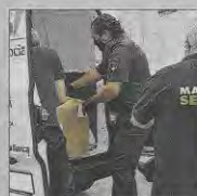
Un momento de la entrega.

La Policía Local, junto a voluntarios de Protección Civil, entregó a Mallorca Sense Fam los alimentos recogidos en su campaña de productos destinados a personas necesitadas. La campaña se ha desarrollado durante un mes y la recogida se ha llevado a cabo en todas las comisarías y dependencias policiales.