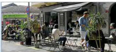
Una de las 'nuevas' terrazas, en Santa Catalina.

El paisaje urbano de la ciudad está cambiando estos días con las ocupaciones, cada vez más numerosas, de las terrazas de bares y restaurantes de plazas de aparcamiento. La Policía Local y la Policía Nacional han intensificado su vigilancia este fin de semana.