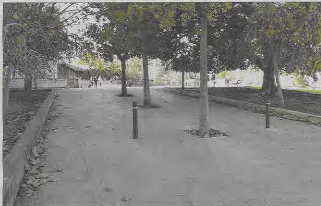
A principios de 2019, Cort colocó pilones para impedir el paso de vehículos a la plaza. M. T.

"Me sorprende que en todo este tiempo no ha habido un avance", comentó la Defensora sobre las cuestiones pendientes de resolver y que afectan directamente a los ciudadanos de Palma. "Es un error pensar que los problemas se habrán resuelto por las nuevas circunstancias", mencionó