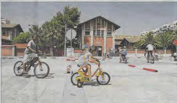
La empresa concesionaria debe hacerse cargo también de la nueva impermeabilización de la plaza de s'Escorxador, de forma que quede suficientemente protegida. Este espacio tiene las actividades restringidas.