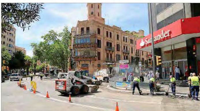
Las obras en la vía pública son una de las principales causas de ruido en las ciudades.