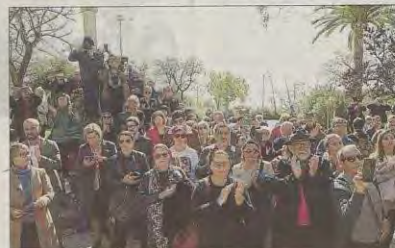
El acto contó con la asistencia de cerca de un centenar de personas.