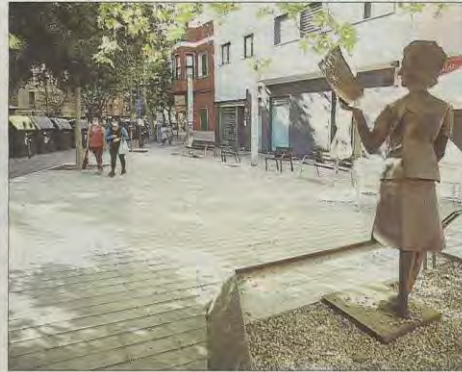
Vista de la plaza, que apenas disfrutan los vecinos.

Una queja habitual en este tipo de situaciones es que cuando se llama a la policía ésta no acude, «y en nuestro caso es siempre así», comenta desesperado el denunciante.