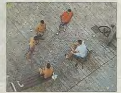
Jóvenes bebiendo y sin mascarilla en la plaza, el pasado fin de semana.