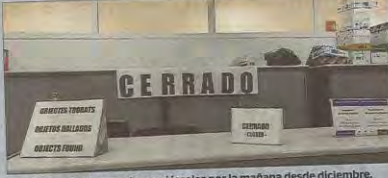
La oficina solo abre martes y miércoles por la mañana desde diciembre.