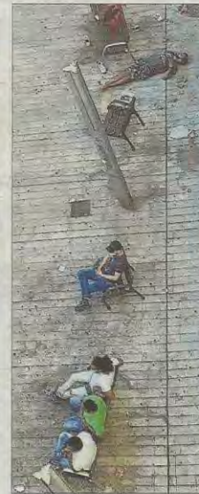
Amanecer. Personas en la plaza el pasado domingo a las 7.30 horas, una de ellas está tirada y dormida en el suelo.

El afectado afirma que «la Policía Local elaboró un informe que aconsejaba la retirada de los bancos de la plaza por considerar que era un punto conflictivo». Dicho informe, asegura, «está en poder del regidor del distrito de