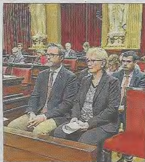
Hila y Moilanen, ayer.