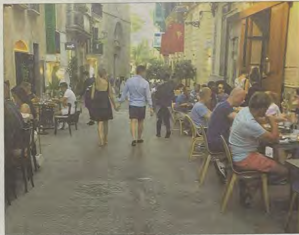
Imagen de la calle Sant Joan ocupada con mesas y sillas pegadas a la fachada de los establecimientos. AA VV SA LLONJA

En este caso el número de expedientes ha pasado en tan solo un mes de 136 a 195. Por último, por lo que se refiere a los expedientes dirigidos al Defensor del Pueblo, que también se tramitan a través de la oficina municipal de la defensora, no han sufrido variación, puesto que en junio había tres asuntos de estas características activos y en julio siguen siendo los