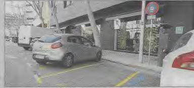
La zona de reserva de plazas llega ya hasta el hotel.

La Policía Nacional aumentó hace unos quince días la reserva de plazas de aparcamiento que tiene en la calle Simó Ballester, junto a la Jefatura, para disgusto de vecinos y ciudadanos en general que ven cómo se han reducido aún más las opciones de estacionar.