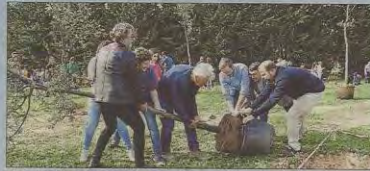
El alcalde Hila y los consellers Mir y Negueruela, en el acto.

Un centenar de ciudadanos colaboró ayer en la siembra de hasta 300 árboles y especies arbustivas en el Parc de sa Riera, convocada por Cort. Se sembraron diferentes especies como pinos, encinas o mirtos del vivero municipal o del centro forestal de Balears.