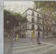
Imagen de la calle Nureduna.

Cort recuperará en septiembre de 2021 la gestión del aparcamiento de las Avenidas y el edil de Mobilitat explicó que «las posibles alternativas para los vecinos de la zona irán ligadas a este parking» cuando se peatonalice la calle Nureduna. Por eso, se descarta un nuevo aparcamiento, como reclama Cs.