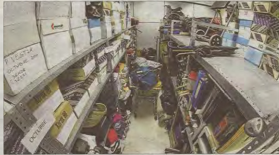
Imagen de archivo de objetos hallados y llevados a la oficina, que actualmente está en el edificio Avingudes.

Desde la Policía, que gestiona esta oficina, se admite que la reducción del horario de atención ha sido debida a las diversas jubilaciones de policías que estaban destinados a este servicio sedentario. La oficina, explica una fuente policial, «es atendida por agentes de cierta edad y tras algunas jubilaciones los que han quedado tienen un régimen de días libres que hace imposible que se pueda cubrir todos los días, habría que enviar a este destino policías que ahora prestan su