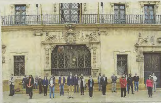
Imagen del minuto de silencio celebrado ayer en el Ayuntamiento de Palma.

Todos ellos mostraron con sus declaraciones su repulsa por este asesinato. «Este minuto de silencio no es simbólico, es un minuto de silencio que quiere expresar nues-