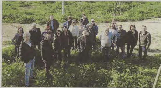
Un grupo de vecinos de barrios cercanos paseó por la zona para mostrar las deficiencias.

El que estaba llamado a ser uno de los proyectos estrellas del Pacte de Cort ya lleva año y medio de retraso sobre la fecha inicial de inauguración. El retraso se debe a las modificaciones del proyecto que han debido hacerse, pero nada justifica la falta de mantenimiento ni tampoco que no se informe de cuándo podrá tener lugar la apertura al público.