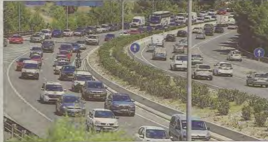
Anillo. La vía de cintura actúa como anillo para la conexión entre periferias en vehículos privados, pero es el centro el que ejerce una mayor atracción sobre la movilidad. El transporte público es también radial y ofrece una deficiente conexión directa entre periferias.

El doctor en Física pone dos modelos como ejemplos. «París es una ciudad jerárquica, con un centro más activo que ejerce una gran atracción sobre la movilidad. Por ello, el centro está muy bien cubierto por el transporte público. Por su parte, Los Angeles tiene una movilidad más complicada, sin un centro jerárquico tan claro, o varios centros a la vez, donde todo el mundo se desplaza de un punto a cualquier