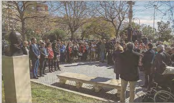
El acto se celebró en la plaza Porta del Camp, donde se encuentra la casa donde vivió el alcalde fusilado. DM

La conmemoración del 24 de febrero tuvo continuidad por la tarde en el Mur de la Memòria del cementerio de Palma, donde se recordó a todas las personas que fueron asesinadas por el fascismo