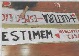
Los vecinos llevan meses luchando por el casal.

Las condiciones que existen hasta el momento presente, explica, son que