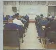
Pruebas para cubrir plazas de policía el pasado fin de semana.

La Policía Local ha empezado el proceso de ampliación de puestos de mando, reservando un 40 % de las plazas para mujeres, después de que el pasado sábado se publicasen en el BOIB las bases que regirán el proceso selectivo para 21 plazas de oficial, 14 plazas de subinspector y una plaza de mayor.