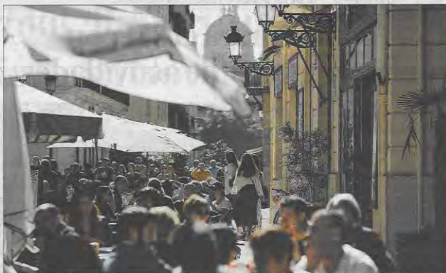
Los derechos de quien ejerce una actividad económica a menudo colisionan con los de los vecinos.

Los padres ojerosos, con el oído afinado por meses de insomnio con el único objetivo de aten-