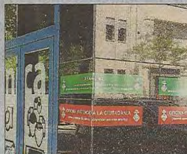
Carteles en el edificio Avingudes que avisan que hace falta cita previa para Urbanisme pero no para la OAC.