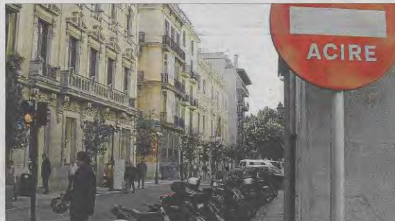
Tan solo los residentes pueden circular por las zonas Acire del centro de la ciudad.

Por si fuera poco, esta persona nunca recibió las notificaciones en su domicilio, al no encontrarse en él, y fue notificada por edicto (mediante la publicación en el BOE), la que «con frecuencia conduce a una situación de indefensión», señala la defensora. Cuando tuvo constancia de las multas ya había pasado casi un año desde la fecha de la primera y todas estaban en vía ejecutiva con las consecuencias que ello supone. La principal es que en este momento ya no se pueden anular y el motivo de la san-