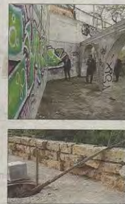
Fotos del estado del parque, con material que parece abandonado, pintadas, árboles caídos y malas hierbas.