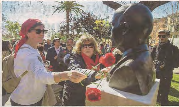
Dos mujeres de Memòria de Mallorca entregan claveles al busto recién inaugurado de Emili Darder. DM

Para que no se olvide el legado del último alcalde de la República, el historiador Antoni Marimon abogó ante los presentes no solo por homenajes como este, sino por "transmitir su pensamiento hacia el futuro, un futuro con más igualdad, más progresista, con más cultura, un mayor acceso a la educación y más arraigado a nuestra tierra". El regidor Llorenç Carró recordó que Emili Darder impulsó numerosas mejoras en esta ciudad para que fuese "más digna", entre ellas la canalización de las aguas y la construcción de escuelas públicas, dispensarios y guarderías para que las mujeres trabajadoras tuvieran un lugar para llevar a sus hijos.