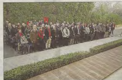
Momento del acto unitario junto al Mur de la Memòria.