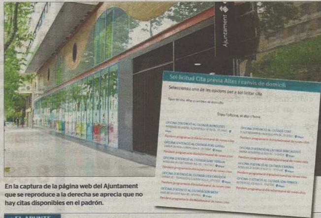
En la captura de la página web del Ajuntament que se reproduce a la derecha se aprecia que no hay citas disponibles en el padrón.

Otros departamento que están generando dificultades a los usuarios son los de gestión y documentación de la Policía Local y algunas áreas del departamento de Urbanisme. En este sentido, los profesionales relacionados con la construcción y los promotores han reiterado sus quejas en los últimos meses por la dificultad para ser atendidos.