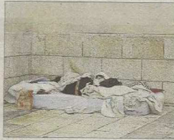
Limpieza. Ayer por la mañana a primera hora se procedió a la retirada de las vallas y la suciedad de los sin techo que viven allí, como se ve en la imagen superior.

Han sido años de espera, pero por fin los vecinos de la Plaça Major, y el resto de ciudadanos, ya cuentan con un ascensor que la une con la Vía Roma. El Ajuntament de Palma procedió ayer a la apertura al público del mismo y, tras las quejas de los vecinos, también retiró las vallas de obra, así como la suciedad, jeringuillas y heces que se acumulaban en la zona, provocada por hasta cinco