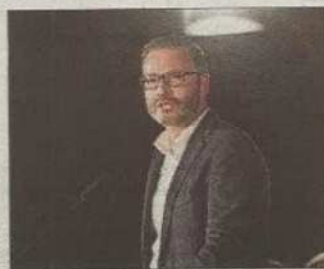
El socialista José Hila.

considera a la oficina un órgano «fundamental» porque es un instrumento más para conocer «de primera mano» las problemáticas de los ciudadanos en su relación con el Consistorio.