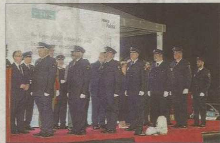
Algunos de los agentes de la Policía Local condecorados.