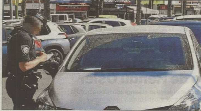
Los sancionados tienen derecho a recibir las multas de tráfico por la vía que escojan, según la defensora.

En este sentido, apuntó la «incongruencia» de que Cort exija a los palmesanos que hagan algunos trámites por vía telemática, como las peticiones de citas previas en algunos departamentos,