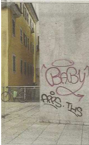
Gemma Marchena / PALMA

Han sido años de espera, pero por fin los vecinos de la Plaça Major, y el resto de ciudadanos, ya cuentan con un ascensor que la une con la Vía Roma. El Ajuntament de Palma procedió ayer a la apertura al público del mismo y, tras las quejas de los vecinos, también retiró las vallas de obra, así como la suciedad, jeringuillas y heces que se acumulaban en la zona, provocada por hasta cinco