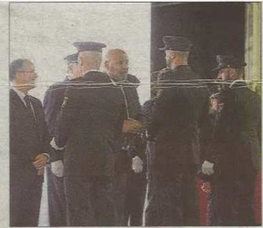
El Grupo de la UDYCO fue muy ovacionado tras poner contra las cuerdas al exjuez Penalva y al exfiscal Subirán.