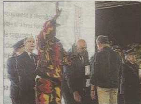
Ciudadanos premiados por hechos meritorios.

El acto estuvo presidido por la comisaria interina Antonia Barceló. Una jefa que ocupa el mando de forma temporal y que en los próximos días será defenestrada al no contar con la confianza del nuevo equipo de Gobierno municipal y tampoco de la mayor par-