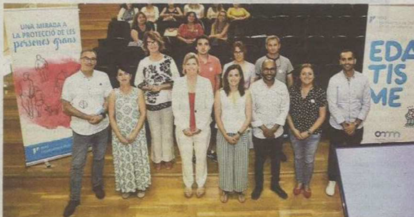
Foto de familia de los ponentes de la jornada junto a las autoridades y miembros del IMAS.

Por otro lado, cabe destacar la campaña que ha lanzado Intress, que con el hashtag #noquieroserunmueble busca concienciar a la sociedad sobre este problema.