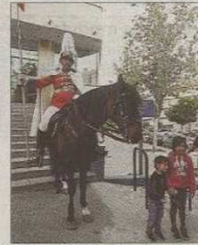
La Unidad Montada de gala recibió a los invitados.