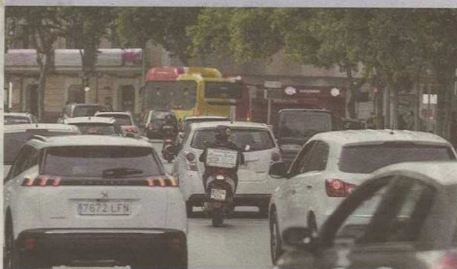
La Zona de Bajas Emisiones restringirá la circulación de coches en el centro de Palma.