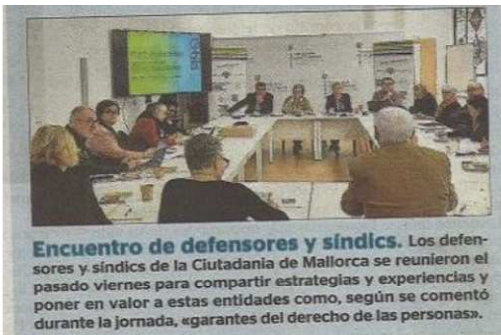
Encuentro de defensores y síndics. Los defensores y síndics de la Ciudadanía de Mallorca se reunieron el pasado viernes para compartir estrategias y experiencias y poner en valor a estas entidades como, según se comentó durante la jornada, «garantes del derecho de las personas».