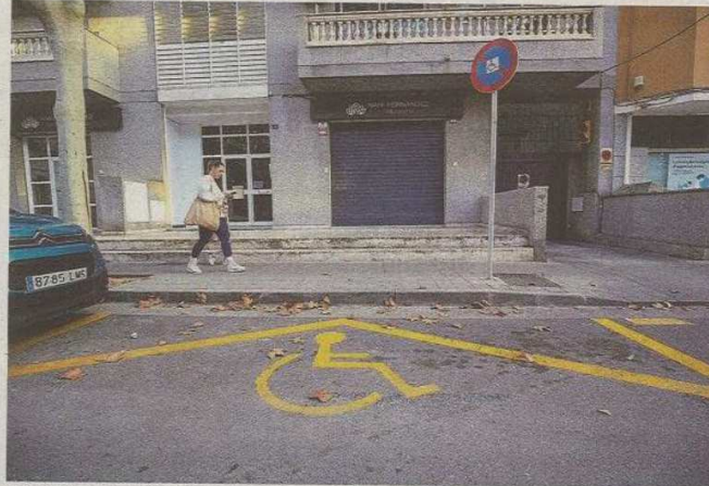
La ley marca tres meses de plazo para resolver una solicitud, pero la realidad es muy diferente.

Según ha constatado la Oficina de la Defensora, los expedientes se amontonan mientras los