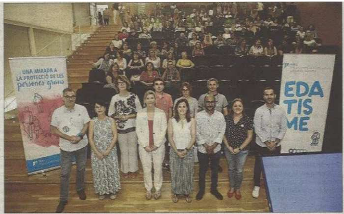
Jornada. La XII Jornada 'Una mirada a la protección de las personas mayores' se celebró ayer en el edificio Gaspar Melchor de Jovellanos, en la UIB, a la que acudieron profesionales, autoridades políticas y los alumnos del grado de Realización Audiovisual del Juniper Serra, entre otros.