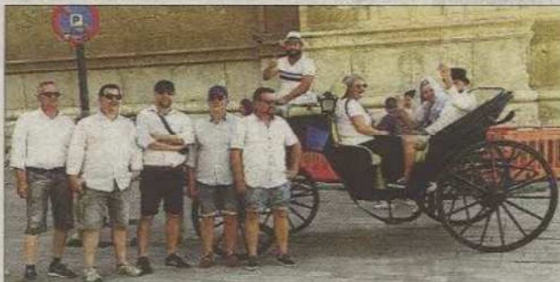
Turistas a bordo de una galera de Palma.

Deudero dijo que «la falta de transparencia y respuesta fue del equipo de José Hila», el anterior alcalde socialista.