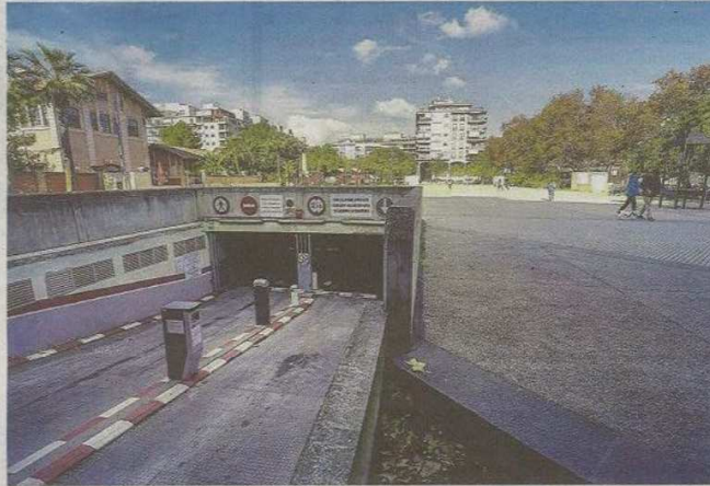
Sobre el parking se extiende una explanada por la que transitan peatones y vehículos de reparto.

«La cuantía de acero se ha reducido en un 71%» en el forjado, advierten los técnicos del SMAP. «Podemos afirmar con certeza que la reducción de capacidad portante es muy importante», indica el informe en referencia a la capacidad de carga de la estructura.