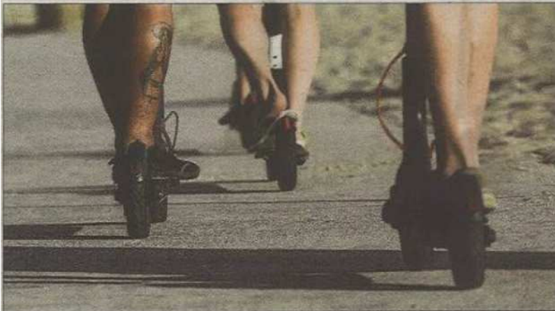
Son ya muchas voces las que piden regular mejor estos vehículos.

La Defensora de la Ciudadanía queda pendiente de ver los próximos movimientos de la DGT quien marca la legalidad de rango más superior y del Ajuntament de Palma, en segunda instancia, de quien espera más ambición, para realizar otra serie de recomendaciones que busquen la pacificación de la movilidad. «Hay que incrementar la vigilancia policial pero también apostar por la seguridad vial, más que por la persecución», señala.