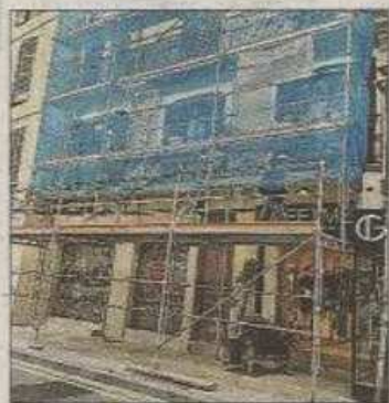
Una de las obras denunciadas.

El próximo lunes la defensora de la Ciudadanía se reunirá en Madrid con el Defensor del Pueblo, Ángel Gabilondo, donde pedirán una nueva legislación sobre la trata y la prostitución. «Palma es conocida como el prostíbulo de Europa en las redes. Necesitamos leyes y fondos para combatir estas actividades en la ciudad», dijo Moilanen.