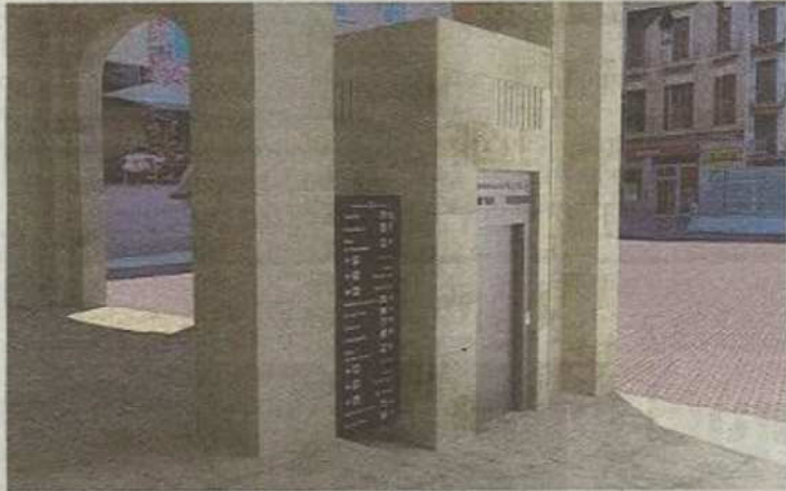
El elevador se colocará debajo de las arcadas.

La decisión se toma después de que la Comisión del Centro Histórico haya aprobado la construcción de esta salida al exterior, la única que tendrá el estacionamiento, debajo de las arcadas de la plaza situadas en las proximidades de su confluencia con la calle Sindicat. La inversión supondrá, tal como manifestó el te-